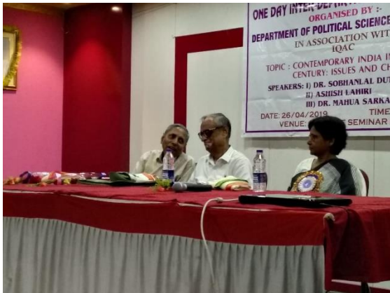
Eminent Speakers in the Seminar